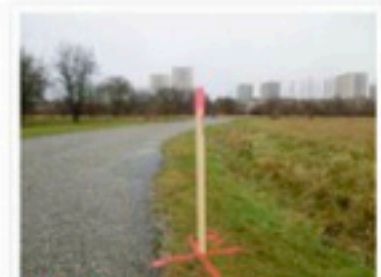
NÄR DU SEER ATT... det sitter pinor nedstuckna över stora delar av Ärstafältet? Det är exploateringskontroll som utför mätningar och geotekniska undersökningar. I slutet av december ska arbetet vara klart.

Det är endast spelåretag som ägs av staten som kan få tillstånd att anordna lotteri och förtäring är därför misstänkt för brott mot lotterilagen. Lotterispektionen hotar att vidta åtgärder om inte förtäring spelare gör rimligt och slutar med sin verksamhet.