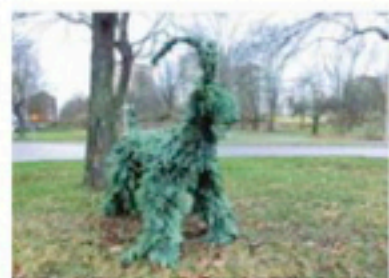
ÄRSTOCKEN ÄR HÄR. Bildens plan är julkorserad.